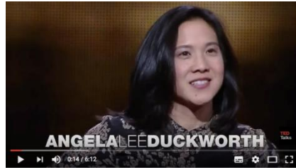
Angela Lee Duckworth : La clef du succès ? La ténacité

Lien: https://www.youtube.com/watch?v=H14bBuluwB8